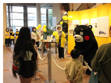
オープニングの挨拶にくまモンがサプライズで駆けつけてくれました。たくさんの笑顔が会場に溢れました