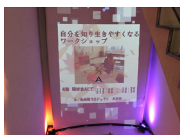
中央階段に団体イベント広報を投影し、ライトアップ。来館者から「キレイ！」の声があがりました

はあもにいフェスタ 2021 ～認めよう！ありのままを 輝こう！あなたも わたしも～ 2021年11月6日(土)・7日(日) 10:00～15:30 参加団体：25の市民グループ 講演会参加者：485人(再生回数1,025回)※YouTube配信 クイズラリー参加者：502人(内ネット参加224人)